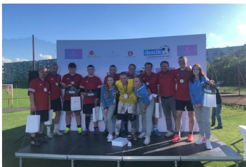
Fotbalový tým Czech Blades