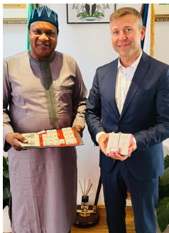
Velvyslanec a čepelky TIGER