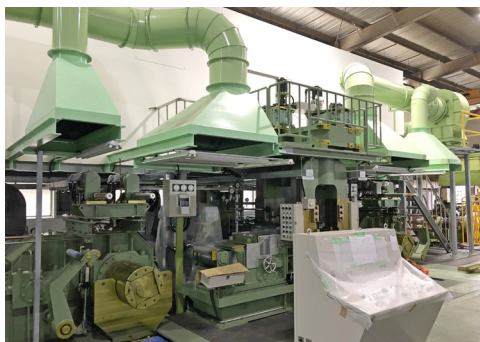
Válcovací stolice – po hodinách válcovacího procesu dosáhne čepelkovina požadovanou tloušťku

Pro naši společnost je Taiwan Tokkin (dceřiná společnost japonského holdingu TOKKIN) přední a spolehlivý dodavatel uhlíkaté oceli pro hlavní výrobní sortiment - čepelky tloušťky 0,13 mm a převážné většiny industriálních výrobků. Spolupráce s ní byla navázána již v roce 2008. Dodavatel zpracovává kvalitní japonskou surovinu a ocel nám dodává ve dvou jakostech: SK-4 a TE-2. Naše spolupráce je založena na profesionální až přátelské úrovni. Jediným problémem je v poslední době námořní přeprava, kdy se nám dodání z původních 6 týdnů prodlužuje na 9, v extrémních případech až 11 týdnů a navyšuje se její cena až na trojnásobek ceny před 2 lety. (AP)