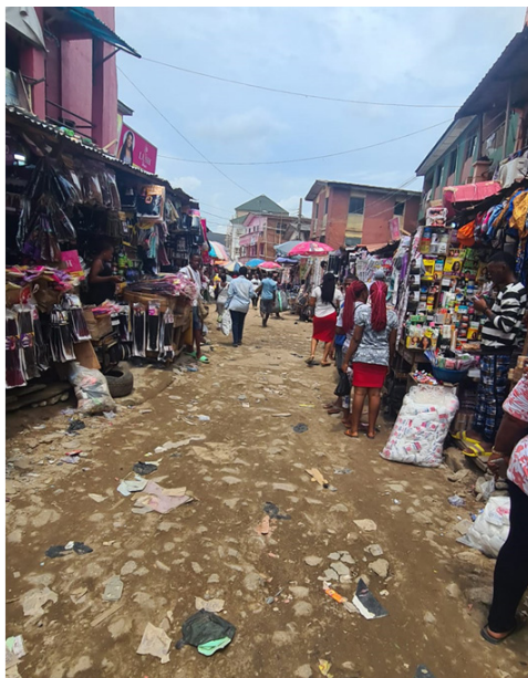
Tržiště v Lagosu je největší v Africe

Naším největším zákazníkem je společnost KUMANTI Ventrures DMCC (t.č. v transformaci do AFRICA INT.) se sídlem v Dubaji. Je sesterskou společností velké distribuční firmy Fareast Mercantile v Nigérii, která prodává exkluzivně naše čepelky TIGER 3H a TIGER Platinum a Superior v západní Africe. Tato firma, která své podnikání v Nigérii začala před desítkami let dovozem rybích hlav z Norska a Skotska, distribuuje mj. sušenky Ovaltines, energetický nápoj Red Bull, značková mýdla, spotřební elektro-