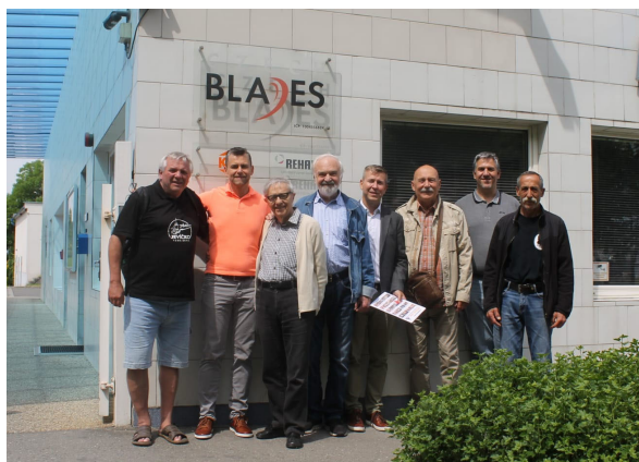
Herci Divadla Járy Cimrmana před vstupem do Czech Bladesa

15. května 2022 nás navštívili herci souboru Divadla Járy Cimrmana, které v Jevíčku a okolí vystupovalo. Zdeněk Svěrák nedal jinak, než že se vyfotí na hale 25 u svěráku, zatímco Miloň Čepelka obdivoval péči a lásku, s jimiž přistupujeme k výrobě nerezových holicích čepelků. Téměř dvouhodinovou návštěvu a příjemné povídání jsme zakončili předáním holítek TIGER všem členům souboru a náhradních holicích