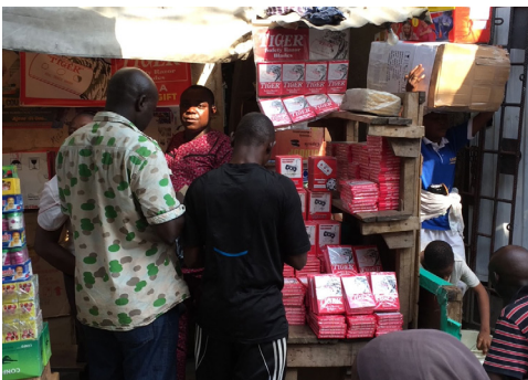
Typický velkoobchodní kiosek s obratem v milionech dolarů ročně

niku ScanFrost a řadu dalších proslulých potravinářských a nepotravinářských značek. Jen v Nigérii dává práci 3571 zaměstnancům a její roční obrat je přibližně 400 mil USD. Smluvní vztah nás pojí se společností Kumanti již od roku 2008 a vztahy s jejími majiteli, rodinou Chanrai (původem z Indie) přerostly na úroveň přátelských až rodinných vztahů. Díky tomu se naše firmy vzájemně podporují v dobrých i těžkých časech. V současnosti se – tak jako řada jiných regionů světa – potýká Nigérie s dramatickým propadem kupní síly obyvatel, která má vliv i na poptávku po našich čepelkách. Tento jev se bohužel opakuje v cyklech a nezbyvá, než nadcházející několikaměsíční propad poptávky vydržet a reflektovat do zvýšení efektivity či úsporných opatření i v naší firmě. (MiM)